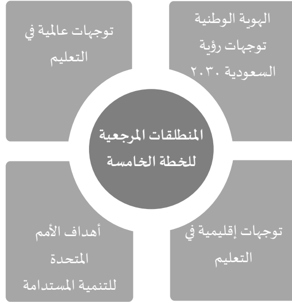
الشكل ٣: المنطلقات المرجعية للخطة الاستراتيجية الخامسة

تنطلق الخطة الاستراتيجية الخامسة للجامعة العربية المفتوحة بالمملكة العربية السعودية من عددٍ من المنطلقات والسياقات المرجعية، والتي تمثل دليلاً لها في تحديد أبرز القضايا والمنطلقات الاستراتيجية في ضوء أبرز الاتجاهات المستقبلية في مجال التعليم العالي ومتطلبات سوق عمل المستقبل؛ وذلك سعياً لتعزيز البناء المنهجي لتوجهات الخطة ومسارات المستقبل، حيث تركز منطلقات الخطة على ما يلي: